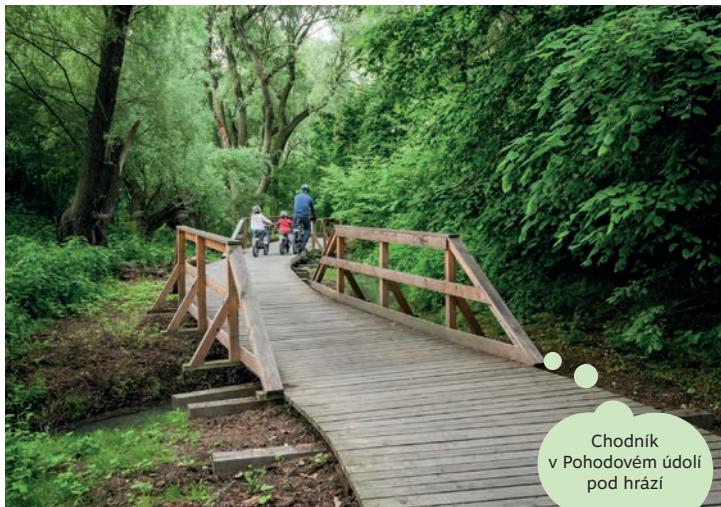
Chodník v Pohodovém údolí pod hrází