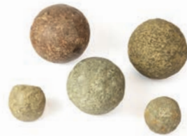
Dělové koule z dobývání říčanského hradu

Chytl vás středověk? • Zahrajte si geolokační hru Za pokladem do středověkých Řičan a poznejte život na hradě i ve městě na vlastní kůži! Aplikaci Geofun si stáhnete zdarma na Google Play nebo App Store.