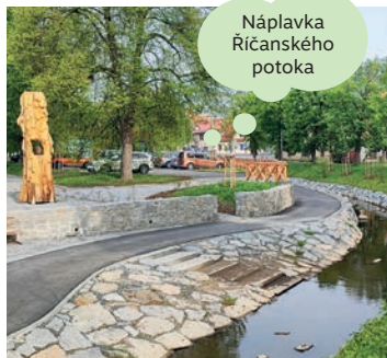
Náplavka Říčanského potoka