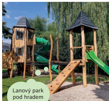
Lanový park pod hradem